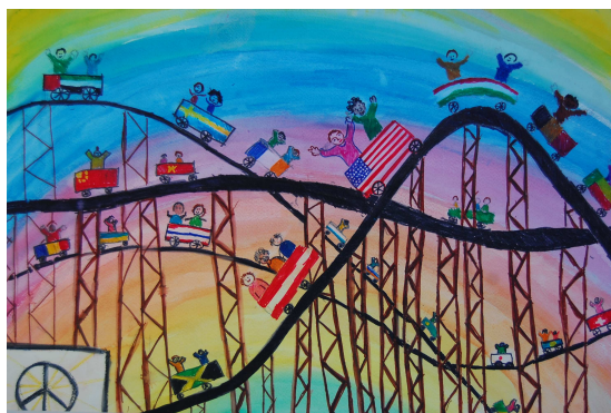
2010 évi magyarországi nyertes

Tudnivalók, előzmények: www.lions.hu , www.lionsclubs.org